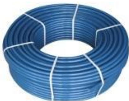
Водоподъёмная труба ПНД ПЭ100 питьевая